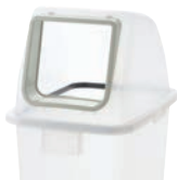
18 21 オープン用