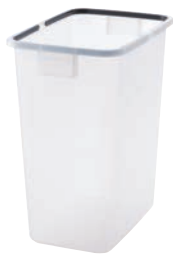
17 20 本体