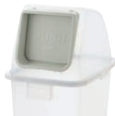
19 22 プッシュ用